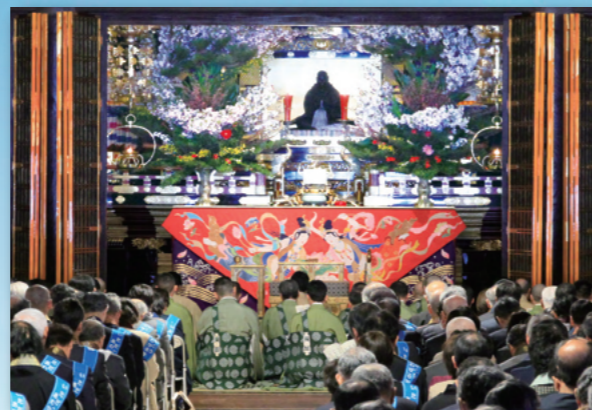
宗祖親鸞聖人750回御遠忌法要

第一期法要期間中 ☆ 毎日午後に法要が勤まります。但し、3月27日は午前に法要が勤まります。